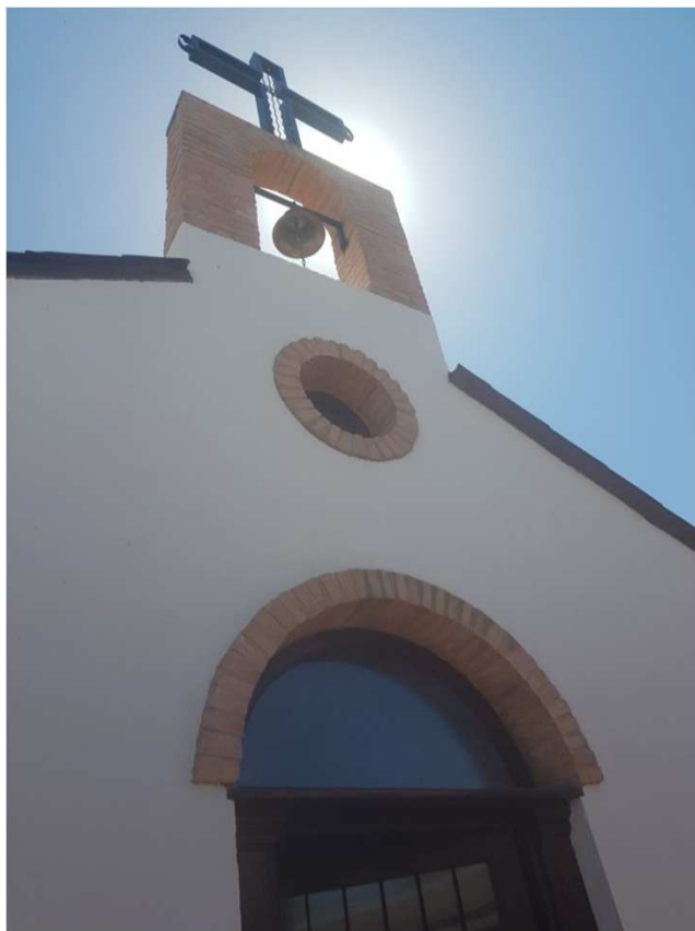
Ermita propia Salón de celebraciones